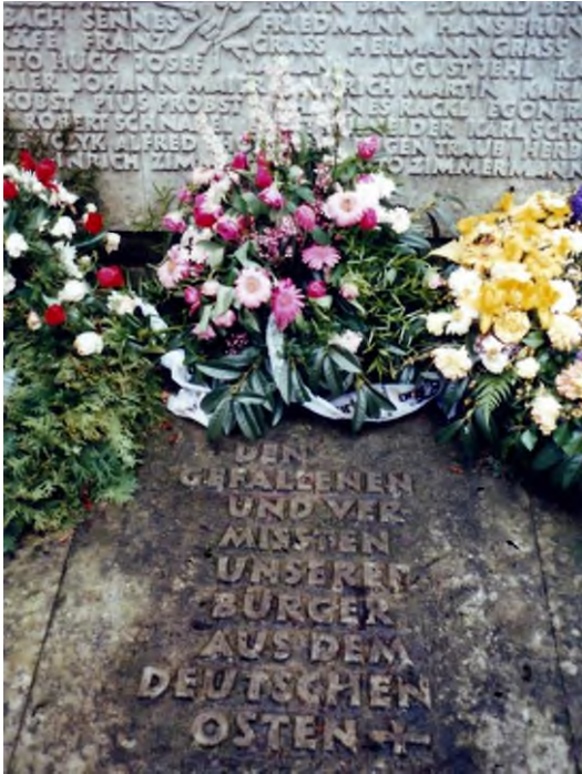
79618 Rheinfelden ⇒