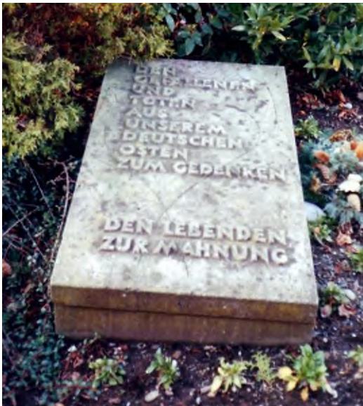
72108 Rottenburg ⇒

Standort: Neben dem Eingang zur St. Galluskirche im Ortsteil Warmbach. Errichtung: 1952 auf dem Friedhof in Rheinfelden eingeweiht und 1954 nach Warmbach verlegt.