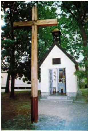
MAHN- UND GEDENKSTÄTTEN DER HEIMATVERTRIEBENEN IN SINDELFINGEN